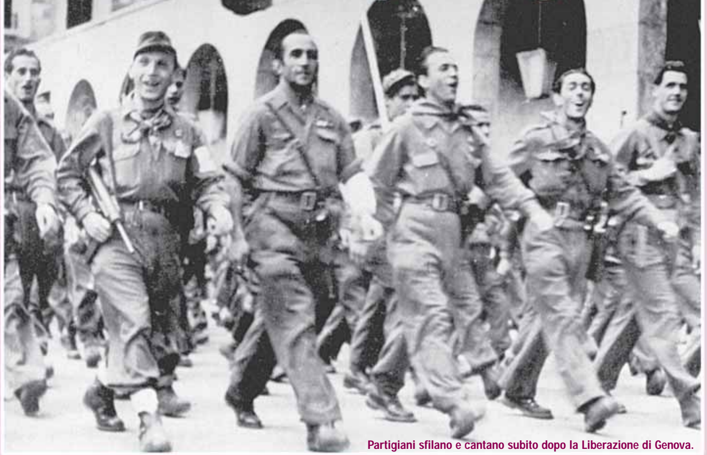
Partigiani sfilano e cantano subito dopo la Liberazione di Genova.

Centinaia i motivi nati in montagna o nelle città. I canti più significativi con musica e parole. Da "Bella Ciao" a "Fischia il vento" a quella per i "Fratelli Cervi". Anche il partigiano Italo Calvino scrisse "Oltre il ponte".