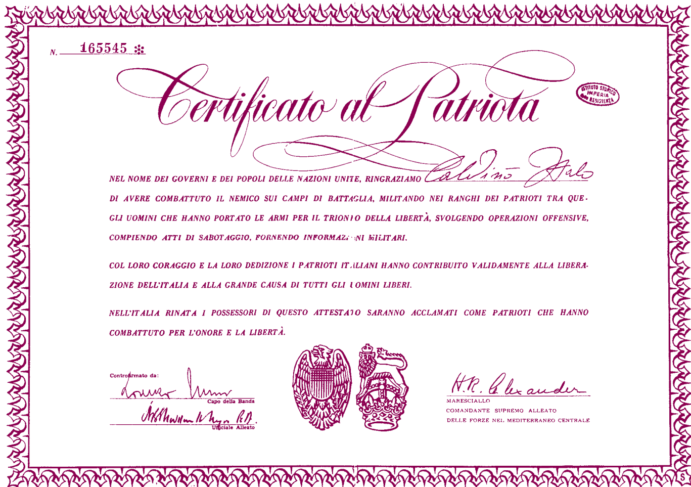
■ In alto: la tessera di appartenenza di Italo Calvino alla Seconda Divisione d'assalto "Garibaldi". Sotto, il ben noto diploma che gli Alleati rilasciavano ai patrioti.